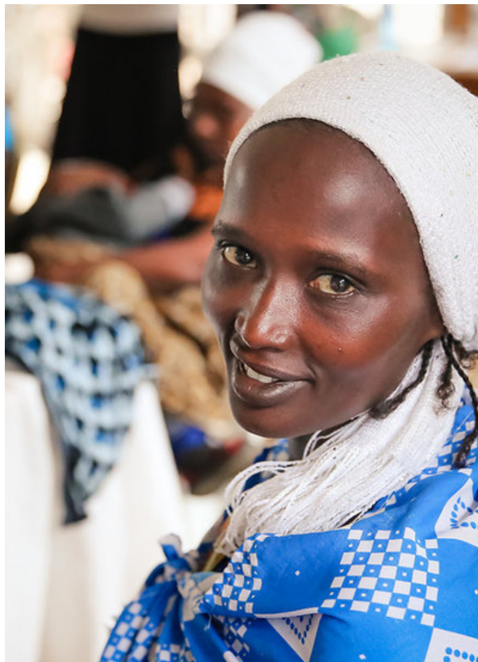
The picture above was taken at a CHW training in Same last May.

Mafunzo ya awali yalifanyika Mai 2014 yakiongonzwa na manesi wawili ambao wana cheti cha ukufunzi kwa watoa huduma majumbani na cheti cha ukunga na walitumia mtaala wa mafunzo uliundwa na Wizara ya Afya. Walitumia filamu za Kiswahili zikionesha ujuzi wa huduma ya afya zilizotengenezwa na shirika la Empower Tanzania, Medical Aid Films na Global Health Media Project, zilitumika kama sehemu ya mafunzo hayo kwa siku 15. Na wanatakiwa kupata mafunzo jerea kila mwaka. Kuhusishwa kwa wanaume wa kimasai kwenye mradi kumechangia sana mradi kufanikiwa. Pia ugawaji wa baiskeli kwa CHWs kumewasidia kupunguza kutembea umbali mrefu kutoka boma moja hadi jingine na imewasiadia kutunza muda.